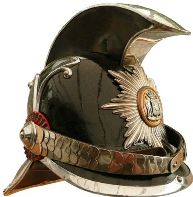
M 1901 fremstillet i 1942