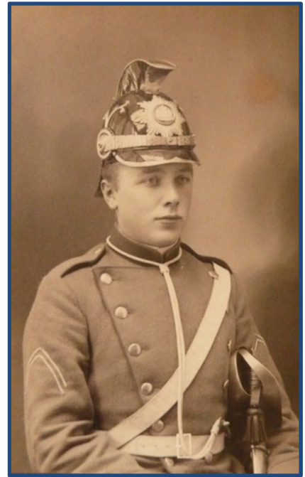
Korporal af 5. DR i Randers med Dragonhjelm M 1901

Fotoet tidssættes til mellem 1912 og 1923