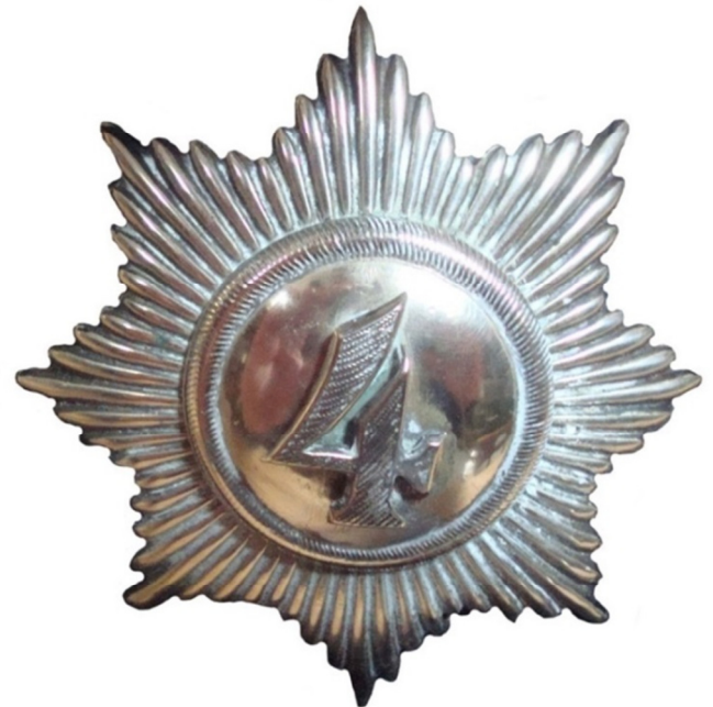
Menigsol for 4. Dragonregiment