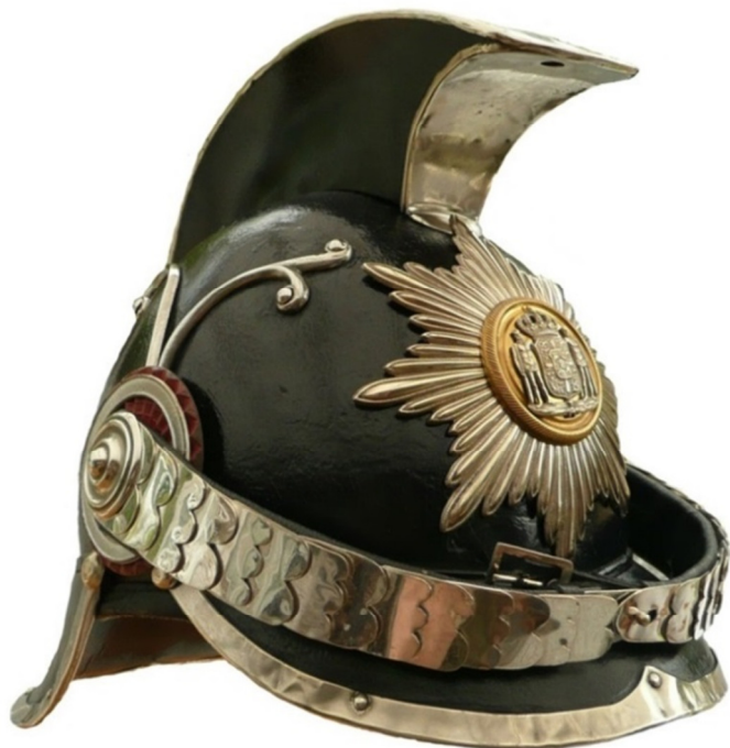
M 1901 fremstillet i 1908