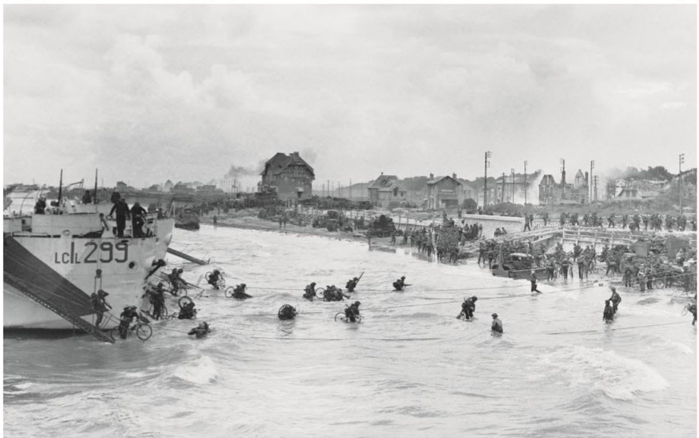
"Resupply" enheder fra 9th Canadian Infantry Brigade (formodentlig Highland Light Infantry) landsættes fra LCI(L) "Landing Craft Infantry Large" fartøjer på Nan White afsnittet ved Bernieres-sur-Mer den 6. juni 1944.

Efter et vellykket gennembrud af forsvarsanlæggene skulle Winnipeg Rifles indtage Graye-sur-Mer, efterfulgt af Banville og St. Croix-sur-Mer. I løbet af eftermiddagen skulle bataljonens A Company, med støtte fra Sherman kampvogne fra 1st Hussars, rykke mod sydvest og byen Creully, hvor der skulle etableres kontakt med de britiske enheder fra 50th Infantry Division, som var landsat på Gold Beach. En manøvre som skulle sikre, at hullet inde i landet mel-