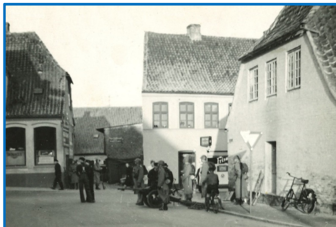
D. 9. april tidligt om morgenen på hjørnet af Sønderbro og Hertug Hans Gade i Haderslev