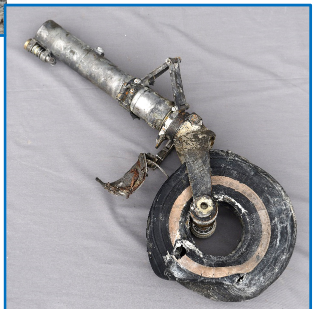
Det rengjorte halehjul, som det blev udstillet

Endvidere dukkede der trykflasker op samt mange skrogdele.