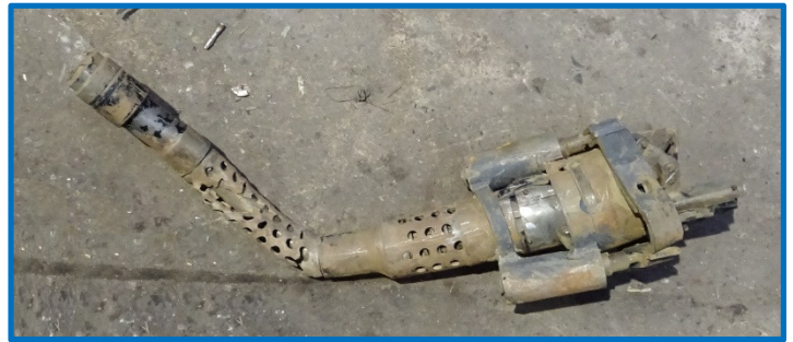
Et af flyets to 13 mm maskingeværer, hvor det værste jord er blevet fjernet