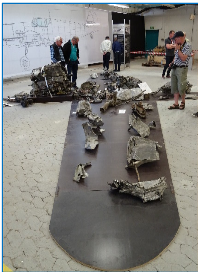
Skabelonen af flyet i naturlig størrelse, hvor de forskellige vragdele efter bedste evne er udlagt, hvor de oprindeligt har været placeret