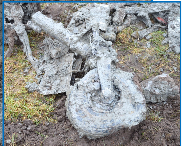
Halehjulet som det kom op af hullet.