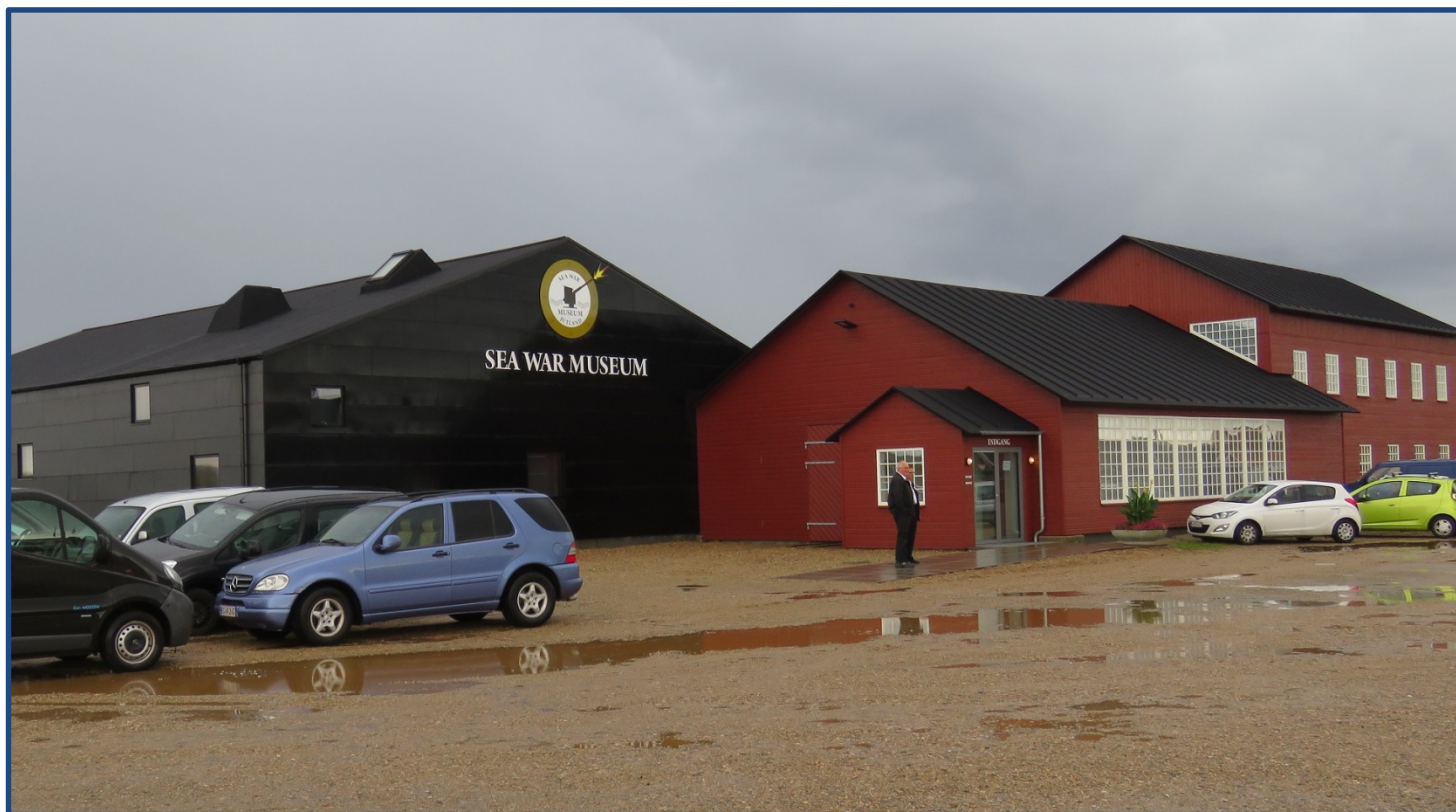
Foto fra indvielsen af museet d. 11. september 2015

Museet omhandler søkrigen under 1. verdenskrig og der udstilles tårne fra u-både, kanoner, torpedoen og miner samt mange forskellige effekter og dokumentation.