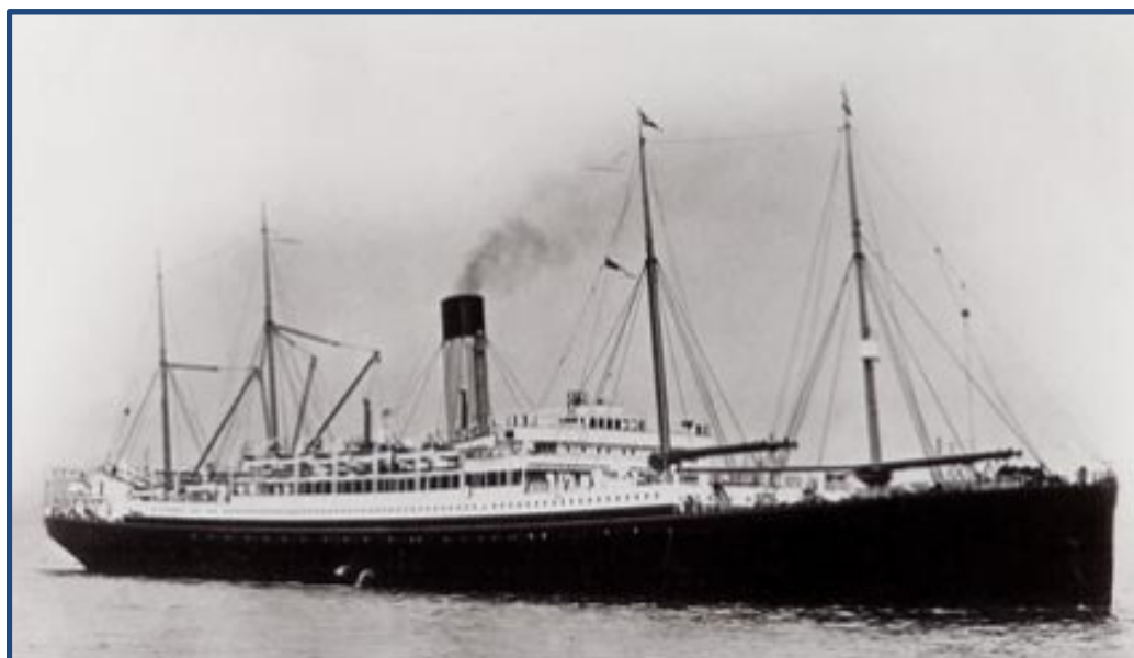
Troppetransportskibet HMAT Ceramic

Tre fjerdedele af bataljonen blev rekrutteret i Western Australia, og resten i South Australia. Med 13., 14. og 15. Bataljon dannede man 4. Brigade under kommando af oberst John Monash (Senere generaløjtnant).