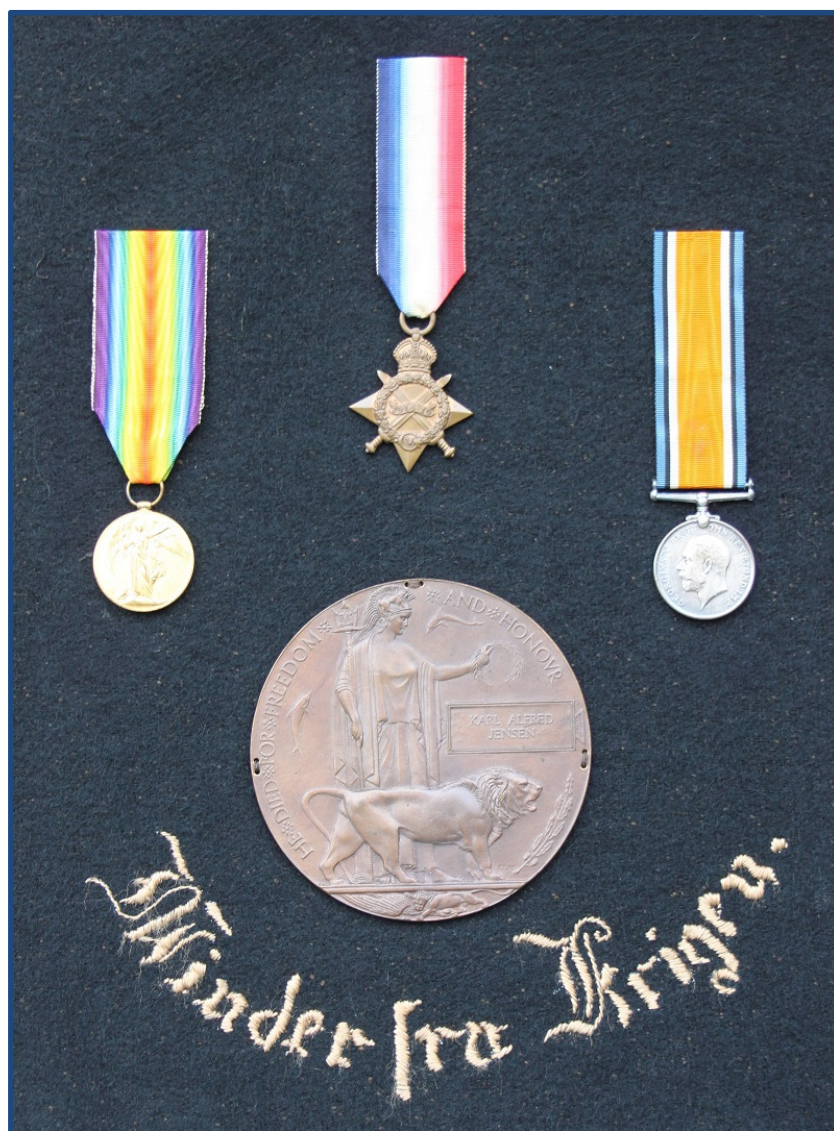
Medaljerne er fra venstre: Victory Medal, 1914-15 Star og War Medal og i centrum dødsplaketten

Efter afslutning på den store krig modtager hans mor og familie posthumt tre medaljer og en dødsplakette med diplom med hans navn på. Medaljerne har indgraveret hans grad, nummer og navn.