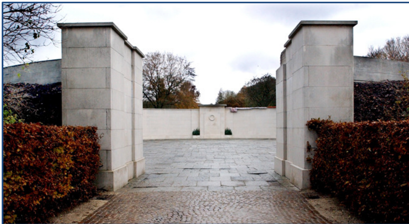
Indgangen til monumentet i Marselisborg Mindepark.