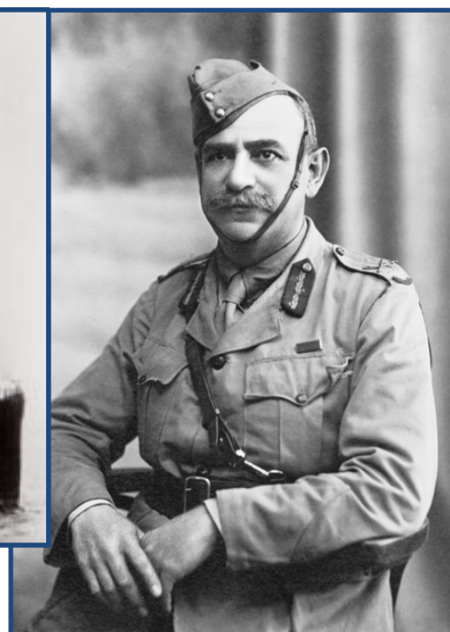
Oberst John Monash

Sydaustralske og vestaustralske rekrutter blev forenet, da bataljonen blev trænet sammen i Victoria. Efter endt grunduddannelse blev bataljonen sat ombord på skibet HMAT Ceramic . Efter et kort stop i Albany, Western Australia, fortsatte skibet til Egypten, hvor det ankommer i begyndelsen af februar 1915.