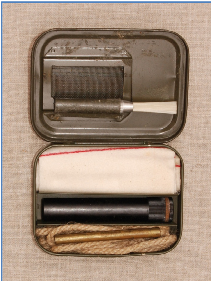
"Tobaksæske" med renserværktøj for den enkelte skytte