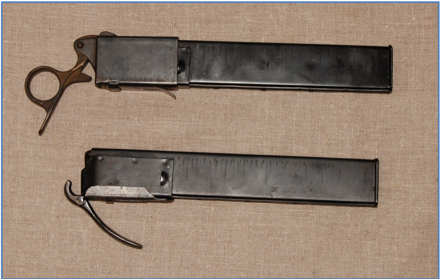
Sten Gun magasiner øverst med bokslader og nederst med den enklere lade-”frø” - på engelsk blev den kaldt ”spoon-type”, på dansk ”ske-modellen”