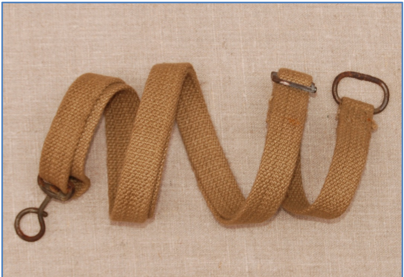
Bærerem til Sten Gun. Krogen til venstre hægtes i overrøret, øjet til højre sættes fast bag aftrækkerhuset, når skulderbøjlen monteres