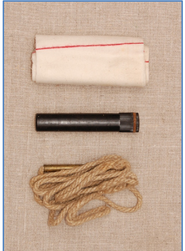
Samme som TV i "skrabet" udgave