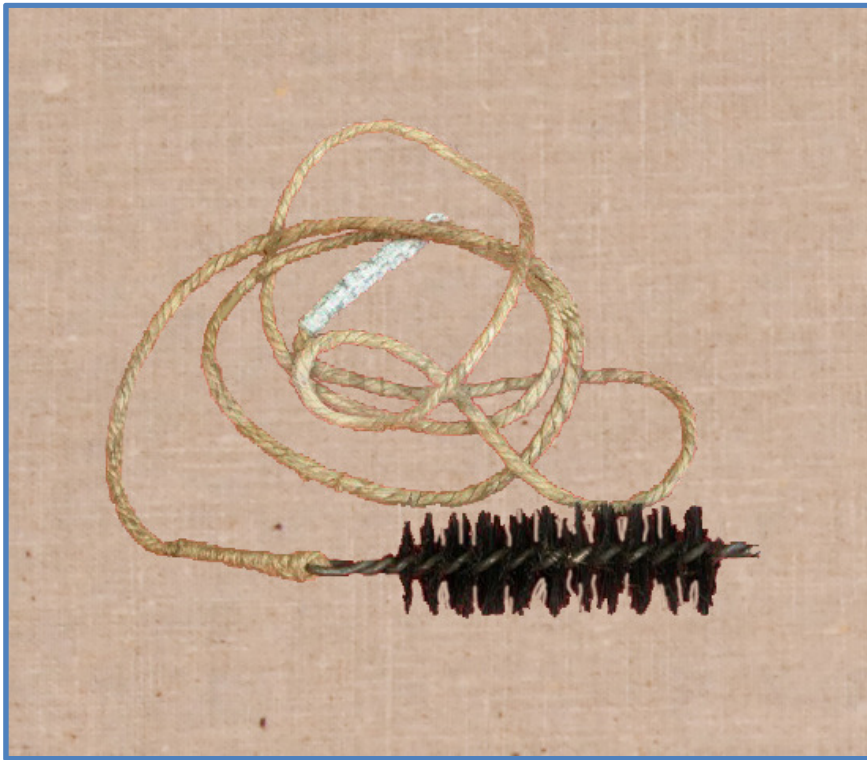
Sjældent set rengøringsbørste til magasiner

TH: Viskestokke. Yderst til højre den ældste model og i midten den senere standardmodel. Til venstre den kombinerede Webley- og Sten Gun-viskestok