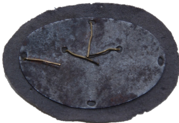
Mærke uden fremstiller (umærket Carl Leburg, Strassburg). Højde: 4,6 cm. Bredde: 7,3 cm.