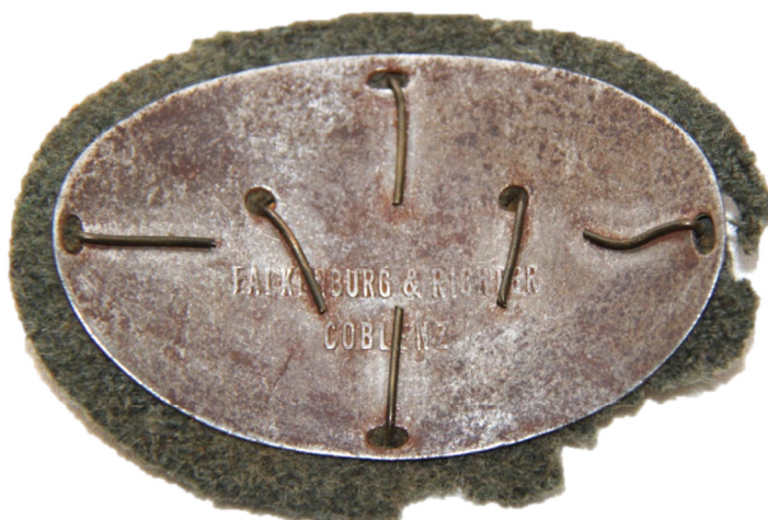
Mærke fremstillet hos Falkenburg & Richter, Coblenz. Højde: 4,5 cm. Bredde: 7,2 cm.