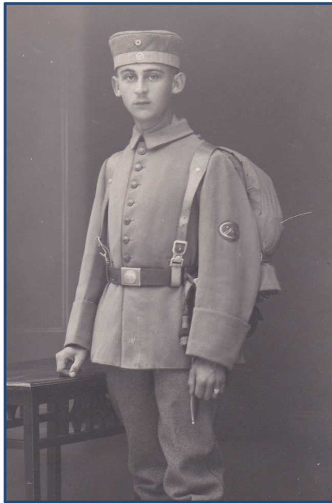
Menig iklædt feltjakke M.1910/14 med felthue M.1907 (Krätzchen) med camouflagedbånd påsat. Billedet er dateret Dresden, september 1917

Det ses dog ofte båret af soldater i de tyske frikorps i 1920'erne, men om mærket fortsat også er blevet produceret i den periode, er uklart.