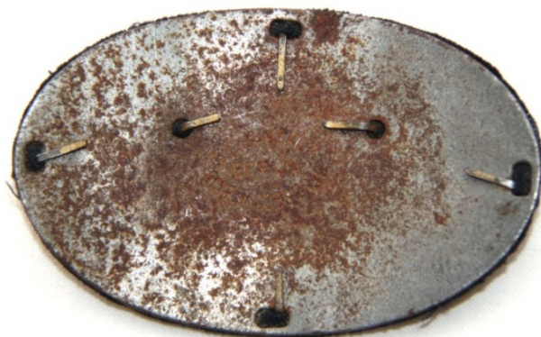
Mærke fremstillet hos C. E. Juncker, Berlin. Højde: 4,5 cm. Bredde: 7,1 cm.