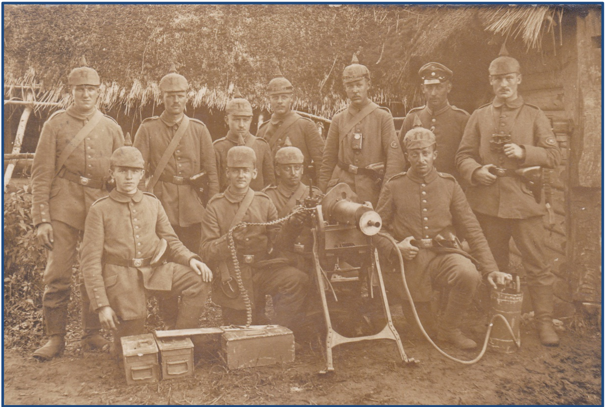
Mandskab og underofficerer ved Maschinengewehr-Scharfschützentrupp Nr. 17.

Fire af soldaterne bærer mg-mærket på uniformsjakken.