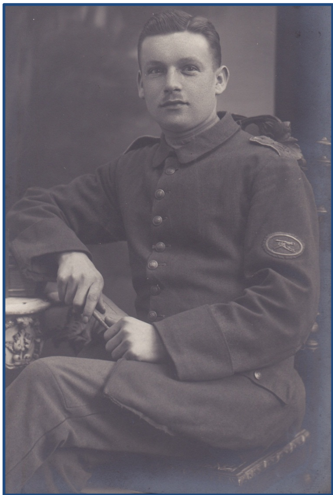
Menig iført feltgrå uniformsjakke M. 1910/14, med mg-mærket påsyet venstre ærme

Den 8. februar 1916 blev der indført et særligt mærke for underofficerer og menige ved maskingeværskarpskytteenhederne. I bestemmelserne om mærket fra det Preussiske Krigsministerium lyder det, at "mærket forestiller et maskingevær udført i metal, omkranset af et patronbånd og monteret på et ovalt stykke feltgråt stof, som bæres påsyet feltjakkens og frakkens venstre ærme midt mellem skulder og albue. Mærket må kun bæres så længe krigen varer".