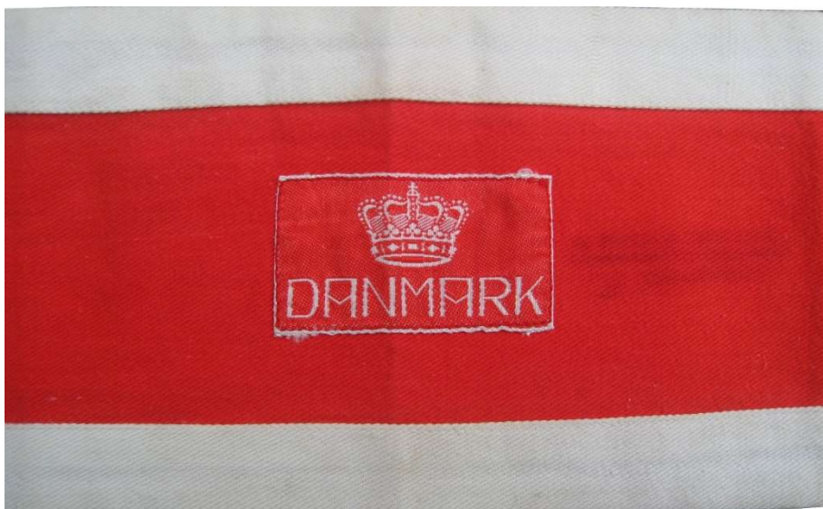
Brigade-armbind anvendt ved ankomsten til Danmark. Disse armbind blev produceret i Sverige

Fra befrielsesdagen den 5. maj blev grænsen til Tyskland bevogtet af lokale frihedskæmpere på den danske side og engelske soldater på den tyske side. Antallet af tyske soldater og værnemagere, der passerede grænsen mod især Flensborg, var imidlertid så stort, at man ikke kunne følge med i identifikationen og tilbageholdelsen af efterlyste.