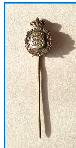
Pin til brug for den i 1946 stiftede Brigadeforening, der som foreningsemblem valgte en miniature af brigadeskjoldet