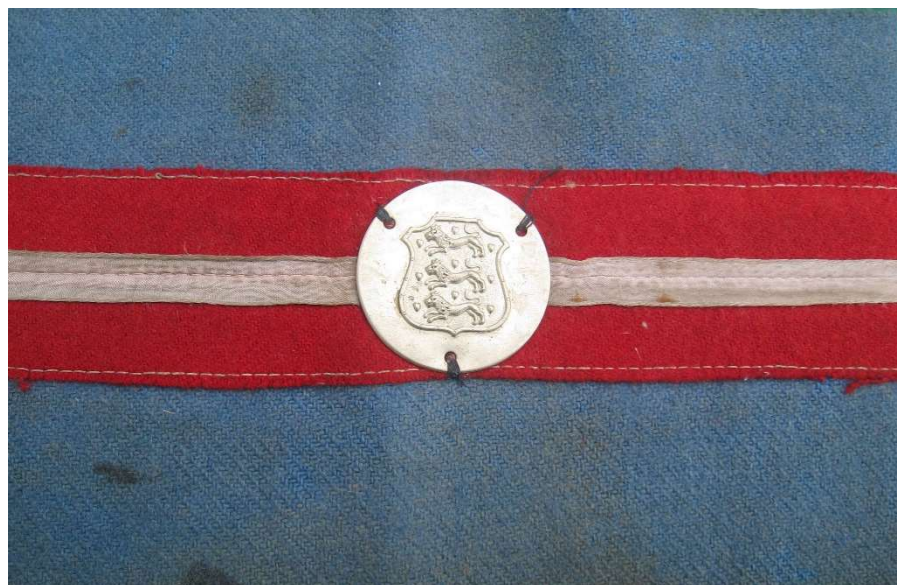
Brigade-armbind af typen, der blev skiftet til, under marchen til København. Genkendelig med nubret skjold, kun én syning i det hvide bånd og ligeledes produceret i Sverige