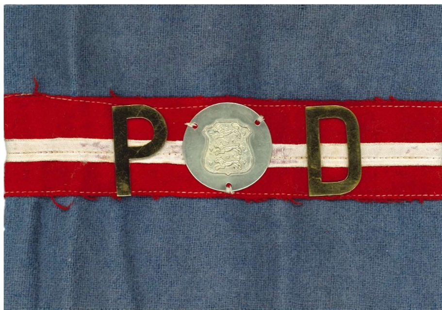
Brigade-armbind med PD for Politidetachmentet.

Feltpolitidetachmentet blev derfor beordret mod grænsen, som man bevogtede fra den 6.-7. maj, indtil man fik hjælp af brigadens hærenheder, der ankom ved grænsen den 10. maj. Hver enkelt tysk soldat, der passerede grænsen, skulle forelægge identifikationspapirer og blev holdt op imod efterlysningslisterne, som feltpolitidetachmentet havde med sig fra Sverige