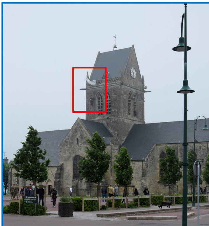
Sante-Mère-Église - hvor en dukke viser omtrent, hvordan private John M. Steele hang i kirketårnet, mens kampene rasede i gaderne og på pladsen under ham