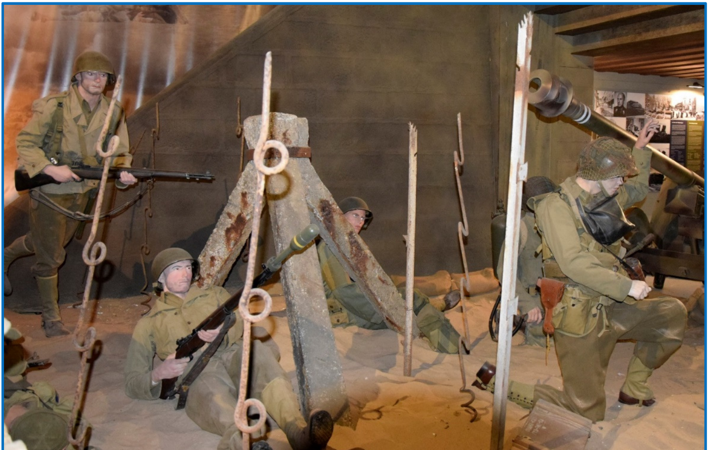
Landgangsscene fra Overlord Museum

OVERLORD MUSEUM - Museet er det nyeste af de 4 museer, og jeg mener, at det der gør dette museum helt specielt er, at det er et museum, som bygger på samlingen efter én mand - en ildsjæl som desværre ikke levede længe nok til at se museet færdig. Men det er et super museum - med et overdådigt landgangs-diorama med køretøjer og mandskab. Et tysk feltpanserværksted hvor en Panther er under klargøring. Hele gader opbygget med kampvogne, halvbæltekøretøjer og soldater.