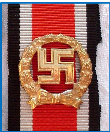
Hæren og Waffen-SS

Senere på krigen var der behov for at bremse yderligere op for tildelingen af Ridderkors og i 1944 blev "Ehrenblattspang des Heeres" indført. Den blev tildelt soldater i hæren og Waffen-SS. Senere på året blev der også indført Ehrenblattspanger for Luftwaffe og Kriegsmarine. Spangen blev båret på jernkorsbåndet på brystet i næstøverste knaphul. Ser man på spangen, som er flot forgyldt, så er det bare et stykke udstandset metalblik på størrelse med en ølkapsel, og den har ikke kostet mange Reichsmark at fremstille. Set i forhold til Det Tyske Kors fra 1941, så fortæller det klart, at krigen er ved at blive for lang og resurserne knappe for tyskerne. Igen for at give denne enkle orden mere vægt, så blev de tildelt navne indført i Wehrmachts æresliste - Ehrenblatt, og for mandskab og underofficerer udløste tildelingen også en forfremmelse. Der blev til hæren og Waffen-SS tildelt omk. 4.500 spanger. Luftwaffe tildelte omk. 180 stk. og for Kriegsmarine er man kun bekendt med 29 tildelinger.