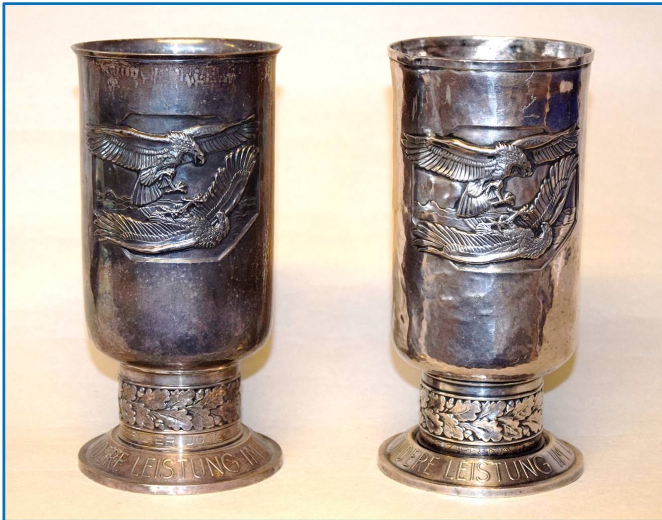
De to udgaver af Luftwaffe-pokalen:

Nedarvet fra 1. verdenskrig indstiftede Reichsmarschall Göring selv Luftwaffes sølvpokal - "Ehrenpokal der Luftwaffe" - i februar 1940. Her var der virkelig tale om en sølvpokal af 420 gram 835 sølv, 20 cm høj og 10 cm i diameter. Men allerede midt i 1942 måtte man rette til på grund af manglende resurser og herefter blev pokalen fremstillet i alpaka (nysølv). I sommeren 1944 blev pokalen udfaset og afløst af blik-kapslen "Ehrenblattspange der Luftwaffe" - virkelig en synlig deroute - på svækkelsen på de tyske kræfter og resurser.