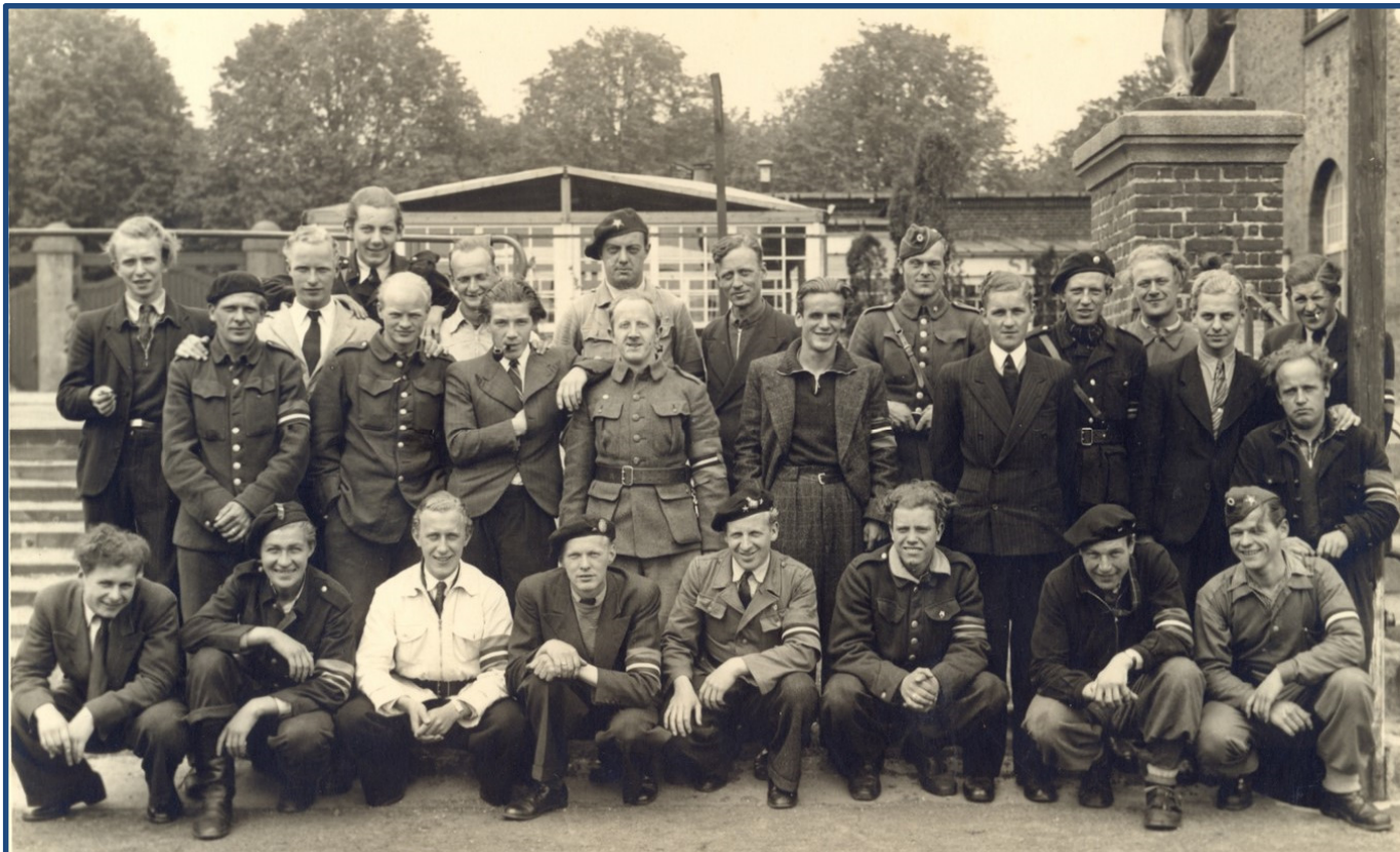
Afsnit 8Ø (Østerbro), 5. Kompagni – ved Idrætsparken

Læs mere om Afsnit 8Ø i artiklen "8Ø - en modstandsorganisation" blad 2 fra 2016