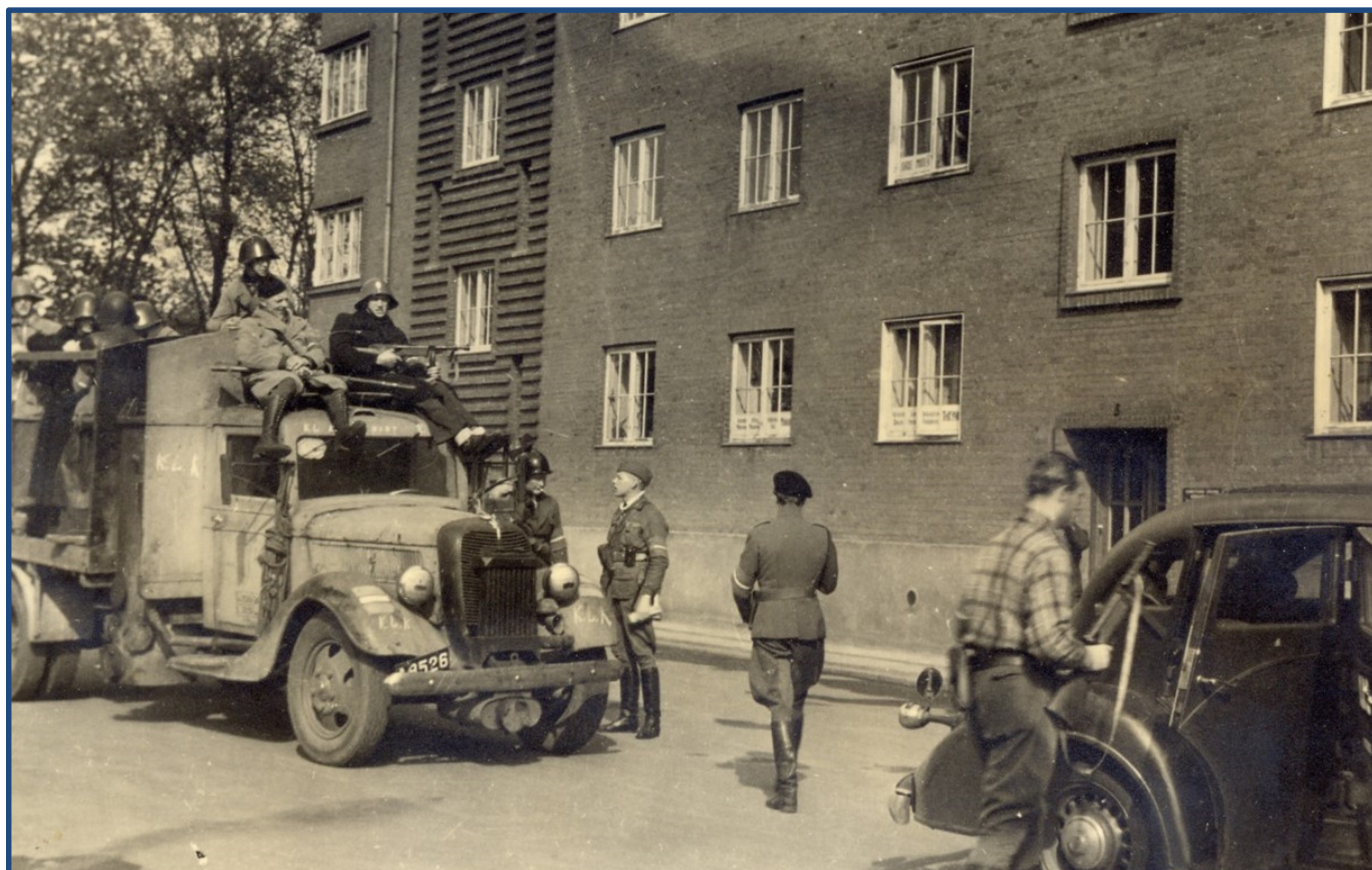
O 1, Livjægerne – "Frihedskompagniet" – fra Kongens Lyngby

Læs mere om Afsnit 8Ø i artiklen "8Ø - en modstandsorganisation" blad 2 fra 2016