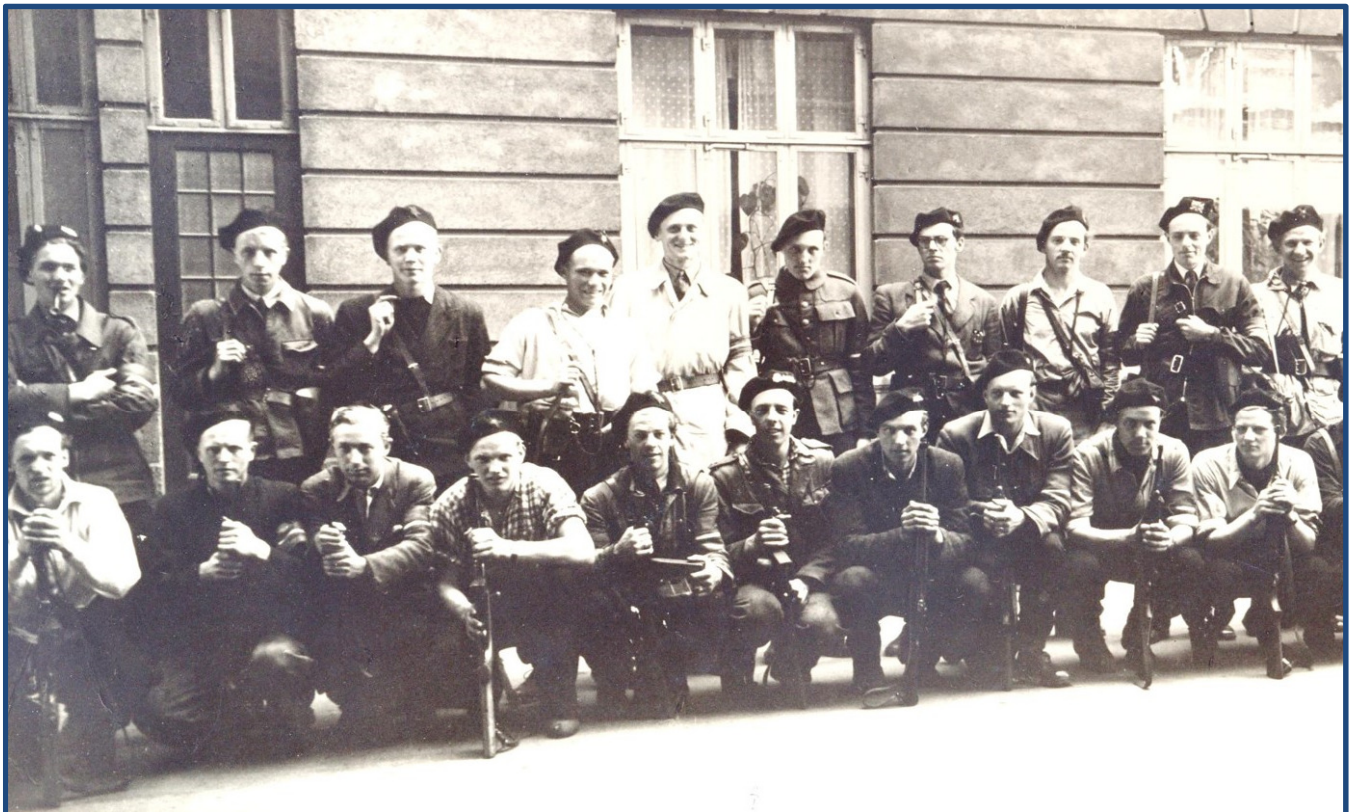
Afsnit 8M (BOPA) – udsnit af Ib's Afdeling – i gården ved Sct. Thomas på Frederiksberg