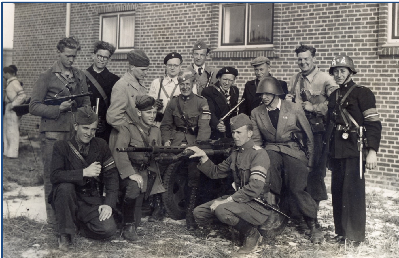
Afsnit 1, Korps Ågesen, 2. Bataillon, 2. Deling, 1. Gruppe, "Kanonkompagniet"

Nyd de efterfølgende fotos fra de forskellige militærgrupper og se mangfoldigheden i uniformering og bevæbning.