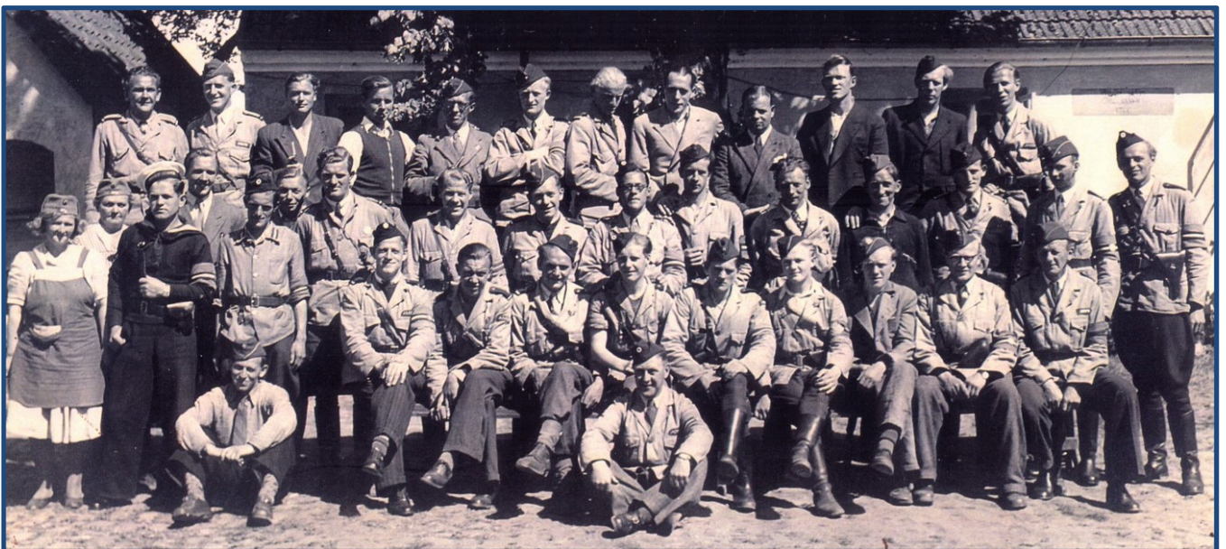
Afsnit 4 (Amager), Kompagni A4 – foran Tårnby Præstegård