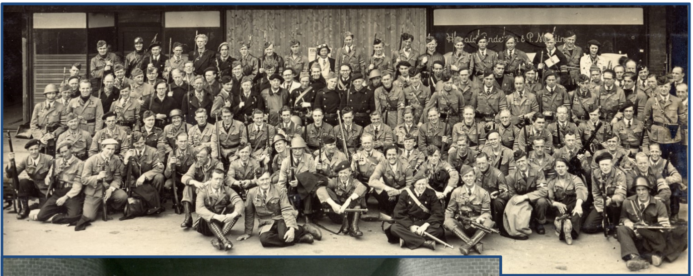
Øverst: Afsnit 5, 1. Bataillon (Vesterbro).

Bemærk at største delen bærer ens uniformer - det er tyske uniformer produceret på Lolland på virksomheden Brødrene Engelhardt.