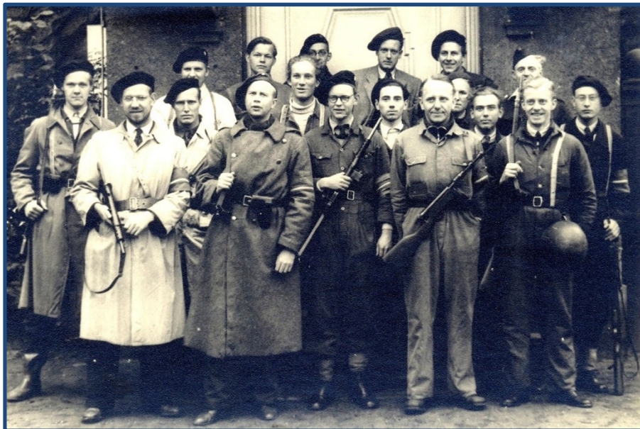
Afsnit 3, P 3, 3. og 4. Deling – foran døren til A. F. Kriegers vej 3, Østerbro