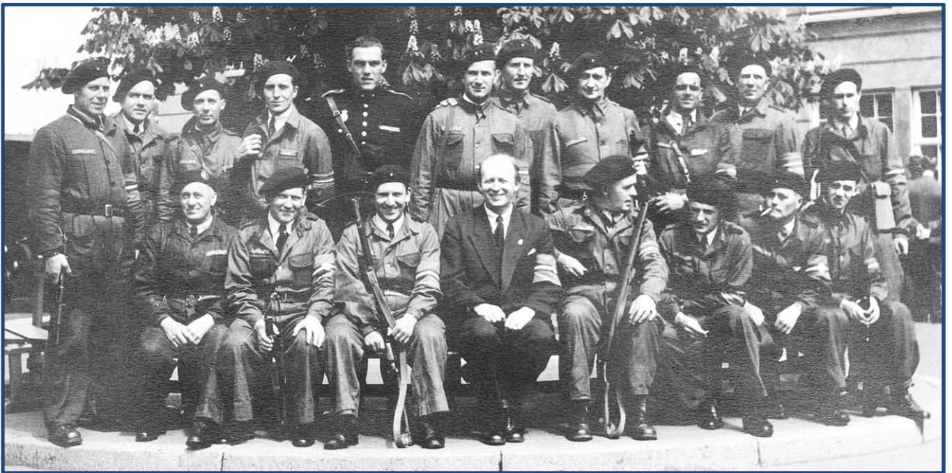
Afsnit 2, Kompagni "Lysglimt" – på Maglegårdsskolen i Hellerup