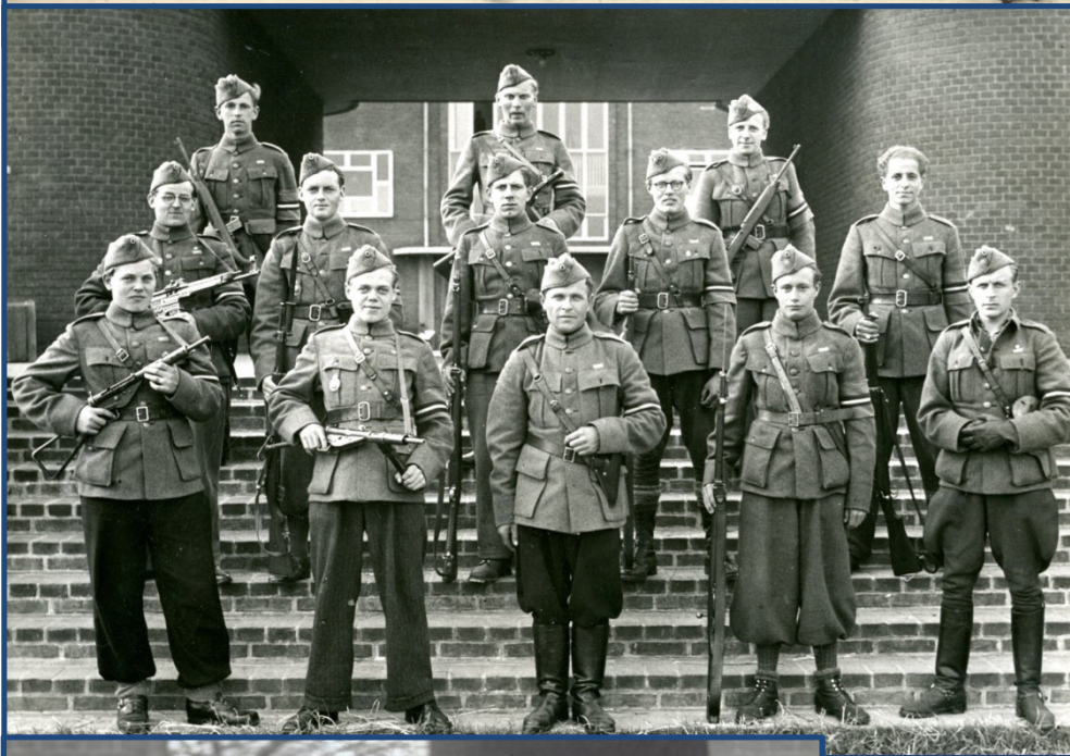
Midtfør: Afsnit 6, Rødovre Kompagniet, 4. Deling – på Hendriksholm Skole

Den tyske ørn blev fjernet fra brystet og i mange tilfælde erstattet med et lille Dannebrog