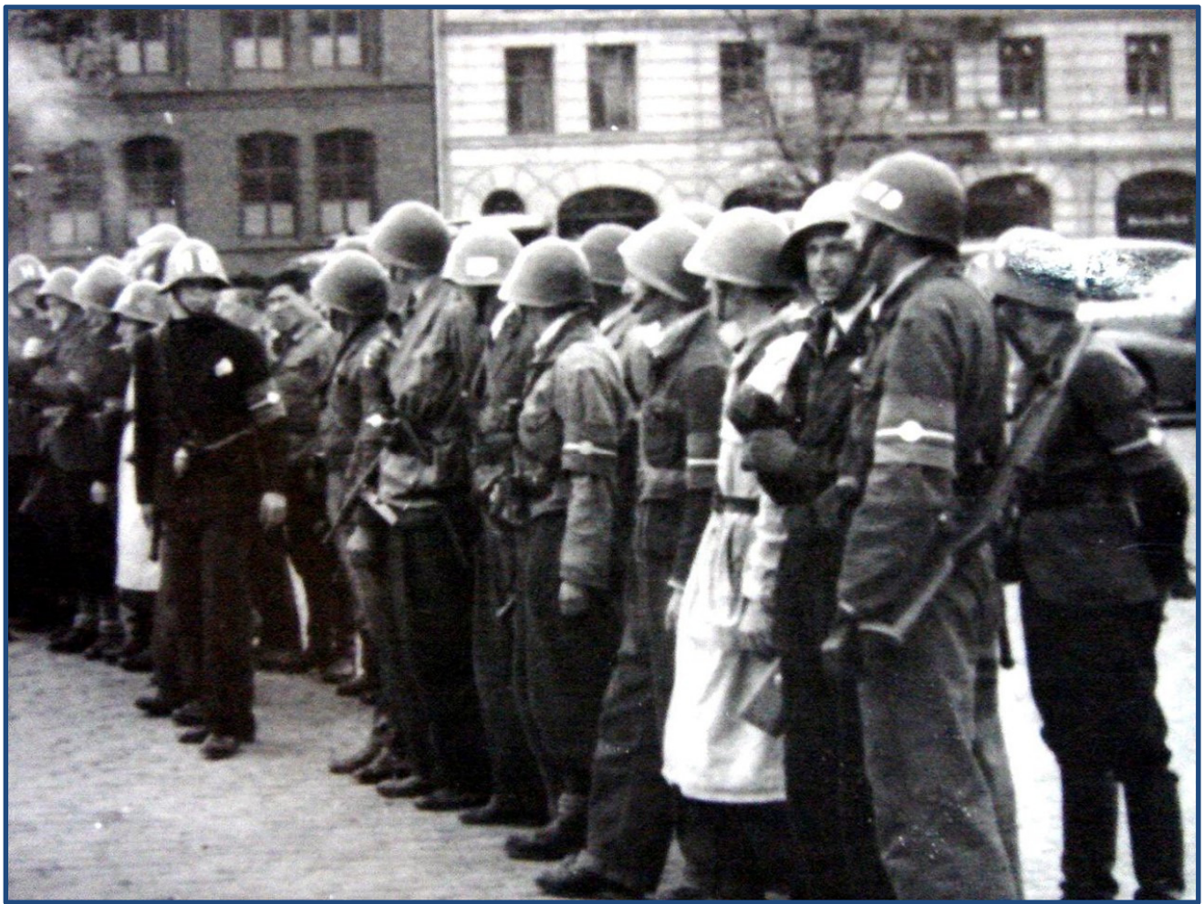
Afsnit 8H (Holger Danske), Afdeling Eigil – på Israels Plads