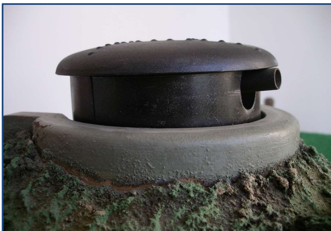
Nærbillede af den hævede og fremkørte bunkerkanon - "Panzerurm"

Igen er der fine detaljer på denne kanonbunkerstilling. Men selvom den har stået højt på mange drenges ønskeseddel, har det kun været i de mest velhavende hjem, at de var under juletræet