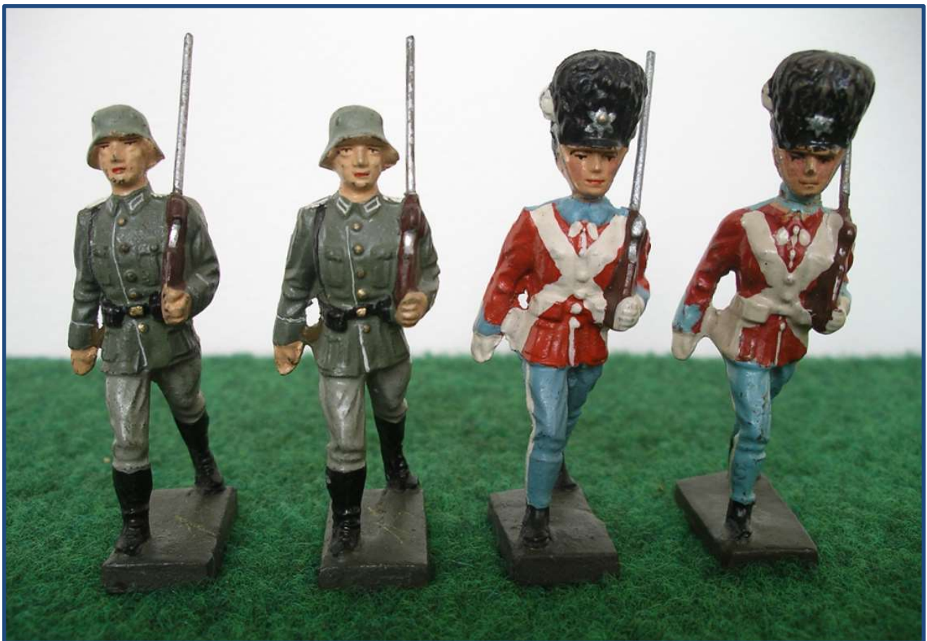
Bemærk hvordan gardernes blå bukser er malet henover de langskaftede støvler, og hvordan de hvide bandolerer er malet henover de typiske tyske 3-delte patrontasker

Danmark var et af firmaets bedste aftagere, og mange vil kende de smukke danske gardere, der egentlig er tyske figurer i danske farver med specielle garderhoveder (se ovenstående foto).